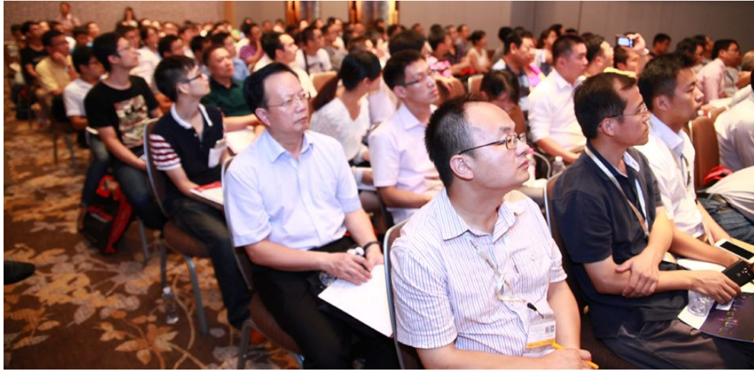
会议现场座无虚席